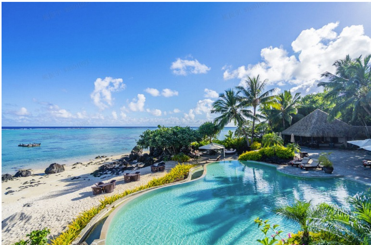
2024年五一假期全国自驾热门海滩TOP10预测