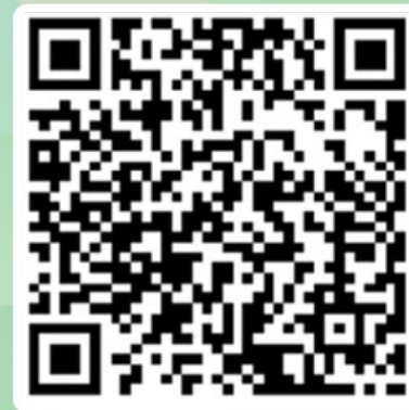
高德交通报告官网