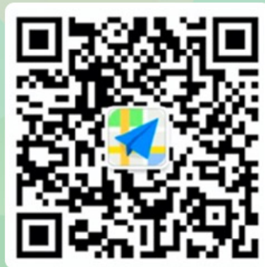
高德大数据公众号