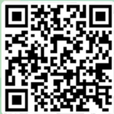
扫码下载高德地图APP